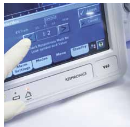
Простая настройка аппарата с учетом маски и контура