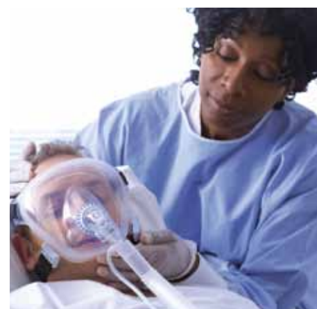
Автоматическое триггирование и переключение с вдоха на выдох с помощью технологии Auto-Trak