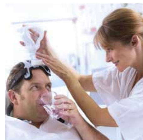
Режим ожидания, используемый во время общения пациента и врача