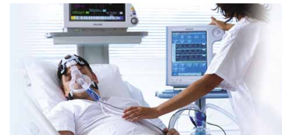
Продолжительная вентиляция в режимах AVAPS и PCV