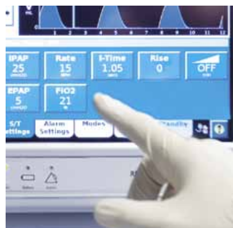
Простая настройка параметров с помощью крупных элементов управления на экране