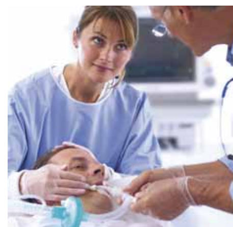
Инвазивный и неинвазивный режимы вентиляции для интенсивной терапии