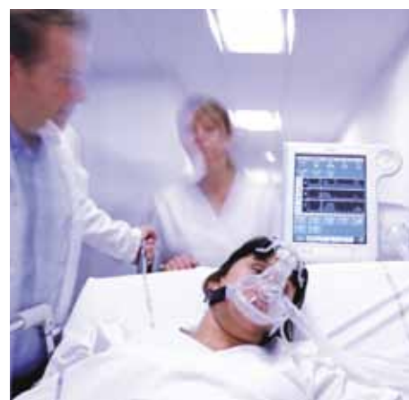
Использование для внутрибольничной транспортировки благодаря встроенному аккумулятору, рассчитанному на 6 часов работы